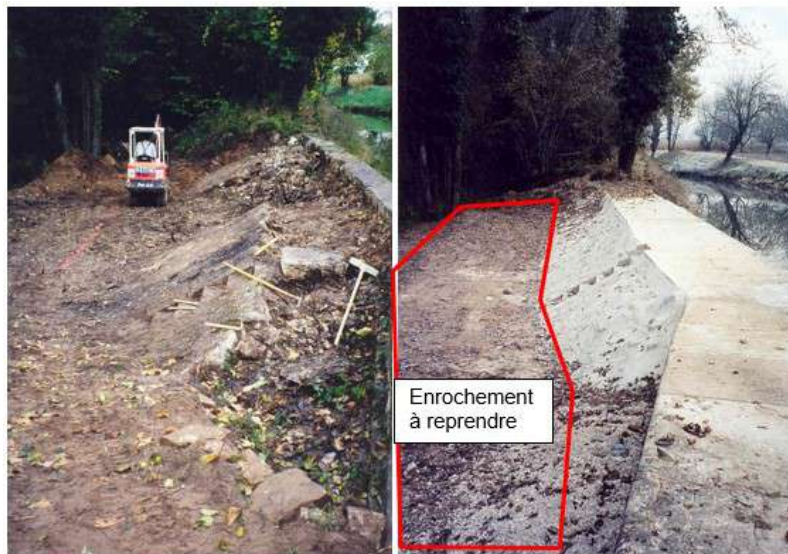
État du guideau avant/après travaux réalisés en 1999

Auquel cas une lame d'eau de 50 ou 60 cm pourrait être attendue sur la zone de travaux selon les débits.