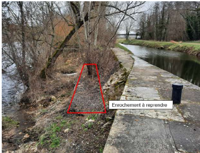
Zone d'enrochements à compléter (bèche de blocage) (photo du 10/03/23)