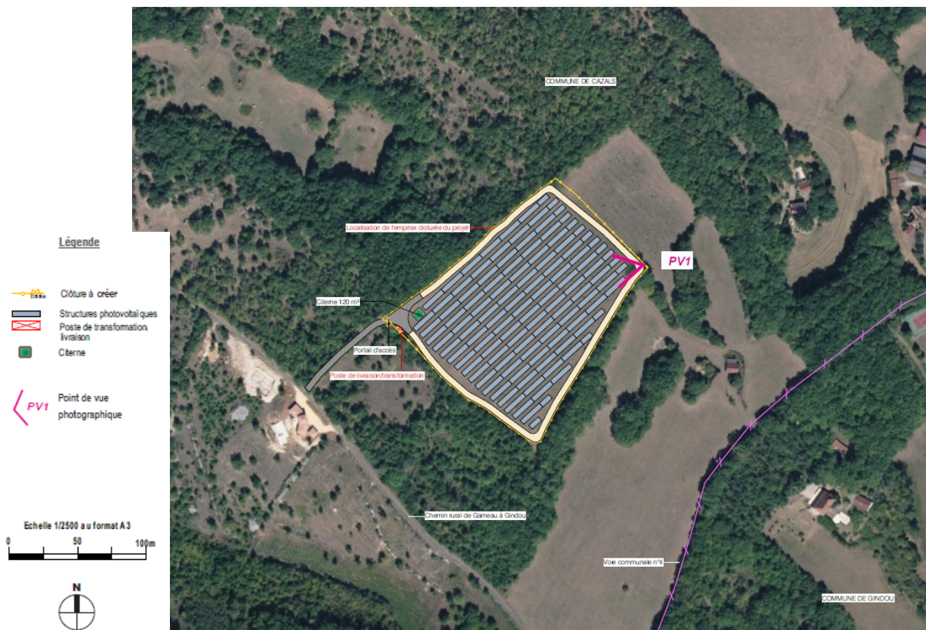
Figure 2 : orthophotographie des principaux équipements de la centrale - extrait de la demande de permis de construire – réalisation I'M IN Architecture

L'entretien sous les panneaux et sur la partie non implantée de panneaux mais clôturée sera effectué par pâturage d'un troupeau ovin. Les panneaux permettront la circulation des animaux et du matériel nécessaire à la fauche des refus (végétation non pâturée par les ovins). Un point d'eau sera raccordé sur la parcelle. Un contrat de prestation de services sera passé entre Arkolia et l'exploitant agricole pour encadrer cette co-activité. La mise en place des panneaux photovoltaïques créera des zones d'ombrage qui pourront, en période estivale, protéger la ressource fourragère des rayonnements du soleil et servir d'abris aux animaux.