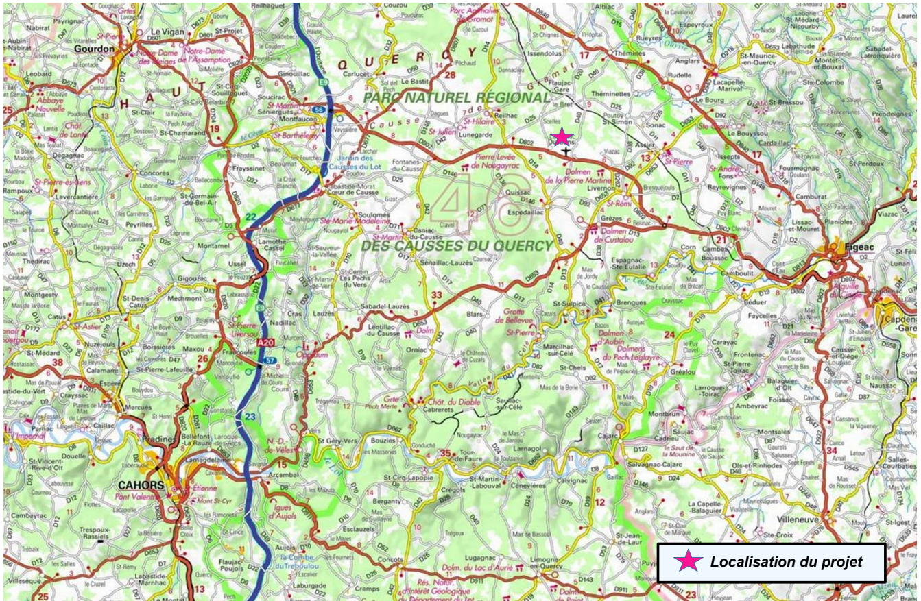
Figure 1 : plan de localisation du projet à l'échelle du bassin de vie – Scan 100 IGN – réalisation MRAe

La société TS008DURB, filiale du Groupe Trina Solar, développe un projet de parc solaire, sur la commune Durbans, dans le département du Lot. Durbans se situe à 35 km au nord-est de Cahors.