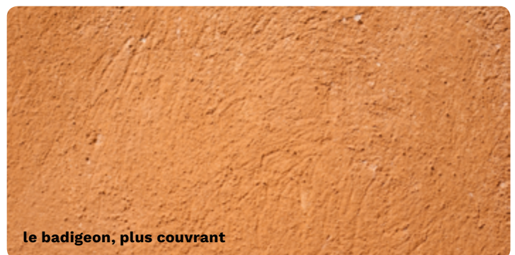
le badigeon, plus couvrant

Le fond de façade en enduit doit être vérifié par un examen attentif. Analysez les teintes de badigeons existantes avant restauration ou décroûtage. Consultez un professionnel (artisan-maçon ou architecte) pour le diagnostic, le suivi et la réalisation des travaux.