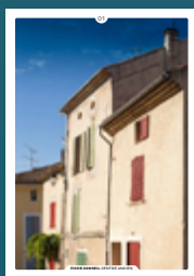
01 les façades enduites

Chaque intervention sur les façades de nos centres anciens compte et participe à l'harmonie du paysage urbain. Au cœur de nos villes et villages, l'intérêt particulier et l'intérêt général doivent être conjugués pour créer le cadre de vie que nous y recherchons tous.