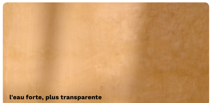
l'eau forte, plus transparente