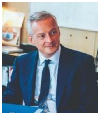
Bruno Le Maire ministre de l'Économie des Finances et de la Relance

Alors que France Relance continue de se déployer, je suis heureux que nous puissions mettre en lumière le rôle essentiel que jouent les TPE et les PME dans la société et l'économie françaises et donc dans la relance. Le commerce, la restauration, l'artisanat, l'entrepreneuriat font partie de notre culture.