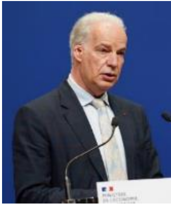
Alain Griset ministre délégué chargé des Petites et Moyennes Entreprises

Les trois millions de TPE/PME du pays ont été fortement impactées par la crise sanitaire. L'accompagnement de l'Etat a néanmoins permis de maintenir un tissu économique robuste et résilient pour la reprise de l'économie. Il est donc naturel que le plan France Relance s'adresse également à ces entreprises qui font la richesse de nos territoires. La relance leur permet de se saisir des opportunités de reprise d'activité tout en entamant ou poursuivant les transformations devenues nécessaires pour répondre aux nouveaux défis postérieurs à la crise sanitaire.