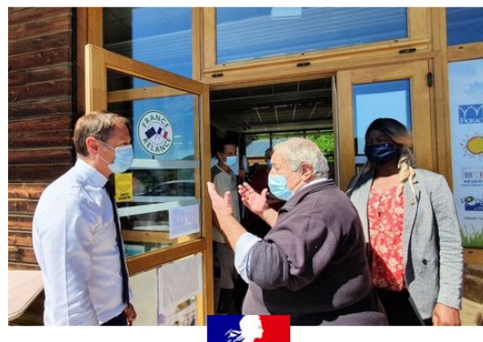
L'association Regain bénéficie d'un conseiller numérique financé à hauteur de 40 000 €.

18 conseillers numériques dans le Lot pour un financement de l'État de 798 000 €