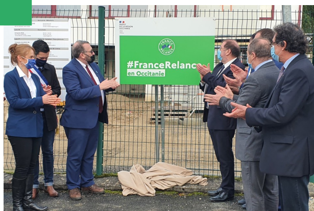
5 février 2021