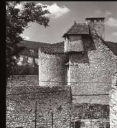
TOUR DE FAURE