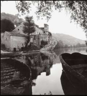
LARROQUE DES ARCS